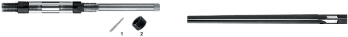
Handruimers, Verstelbaar Pengatruimers, Handgebruik