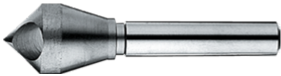
Verzinkers met schuin gat

We hebben een zeer compleet programma verzinkfrezen van zowel HSS, HSS-E als volhardmetaal (VHM) voor u op voorraad liggen. Verzinkfrezen, ook bekend als verzinkboren of soevereinboren, in vele soorten, uitvoeringen, maten en hoeken. We hebben ongetwijfeld exact de verzinkfrees die u zoekt.