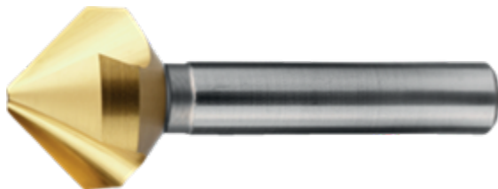
Verzinkers met 3 snijkanten